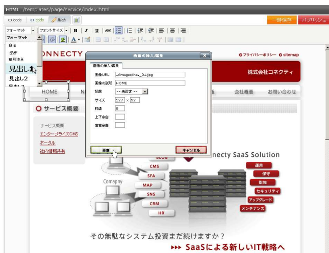
リッチエディター (WYSIWIG 対応)